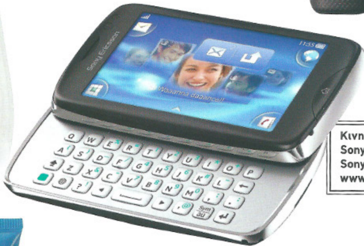
Κινητό τηλέφωνο Sony Ericsson txt pro, Sony Ericsson, www.sonyericsson.com