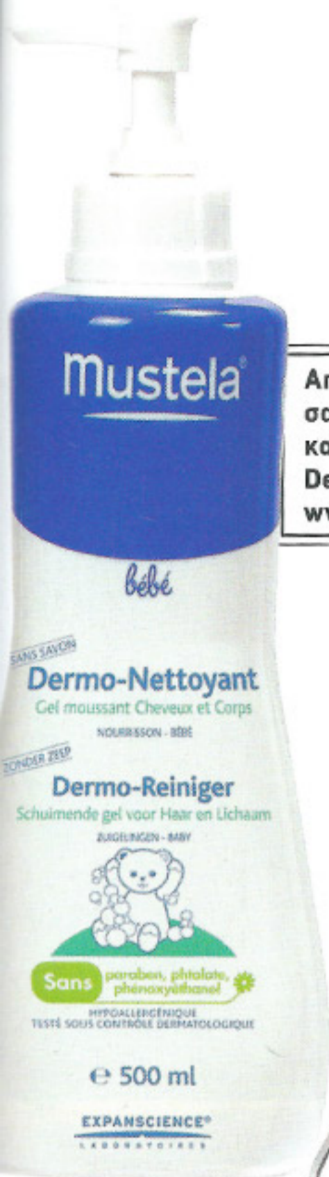
Απαλό gel καθαρισμού χωρίς σαπούνι για πρόσωπο, σώμα και μαλλιά για βρέφη, Dermo-Nettoyant, www.expanscience.com