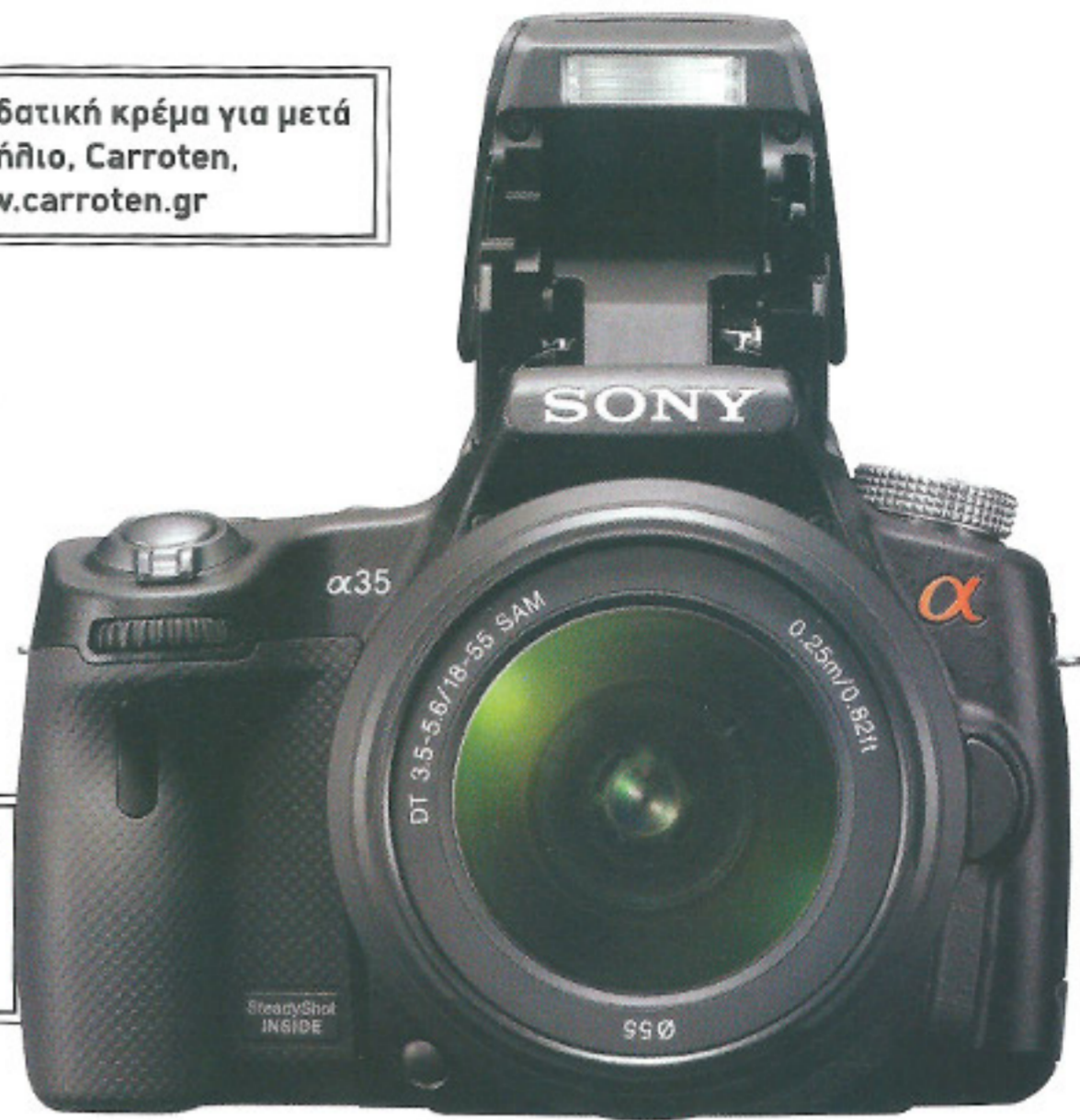
Φωτογραφική μηχανή με 16,2 mpx και νέο, ενσωματωμένο σύστημα Picture Effect, Sony, www.sony.gr