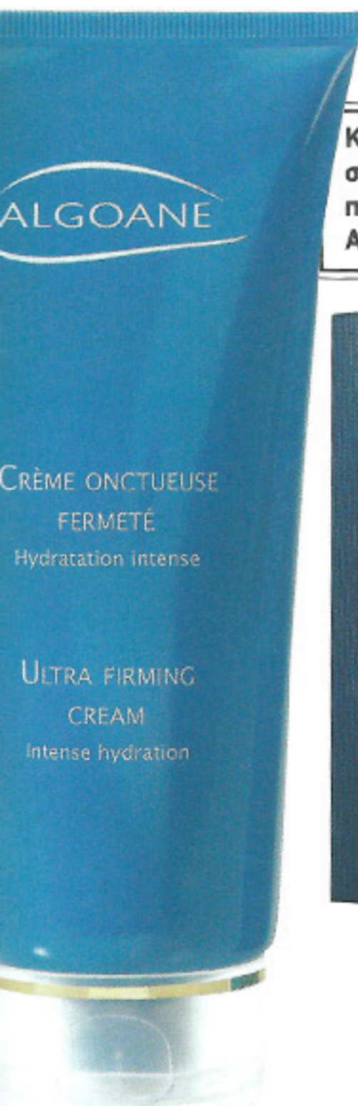
Κρέμα σύσφιξης για το σώμα και ενυδατική κρέμα προσώπου και σώματος, Algoane, www.algoane.com