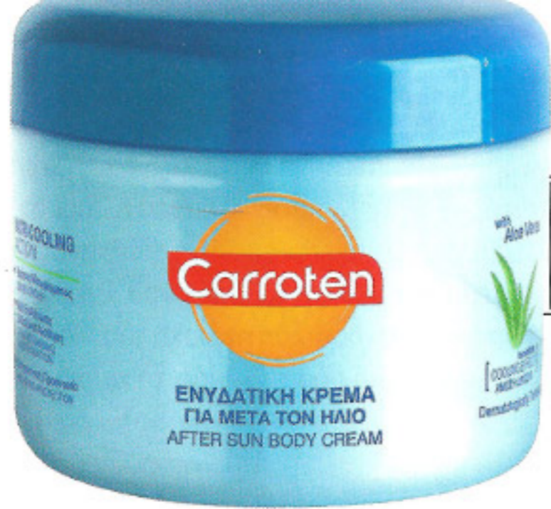
Ενυδατική κρέμα για μετά τον ήλιο, Carroten, www.carroten.gr