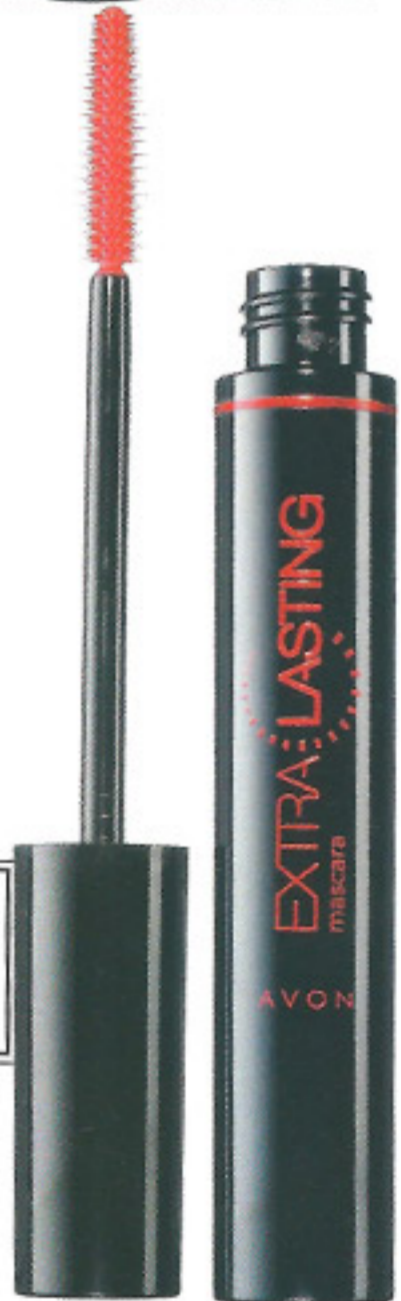
Μάσκαρα μεγάλης διάρκειας για 7 φορές περισσότερο όγκο, Avon, www.avoncosmetics.gr