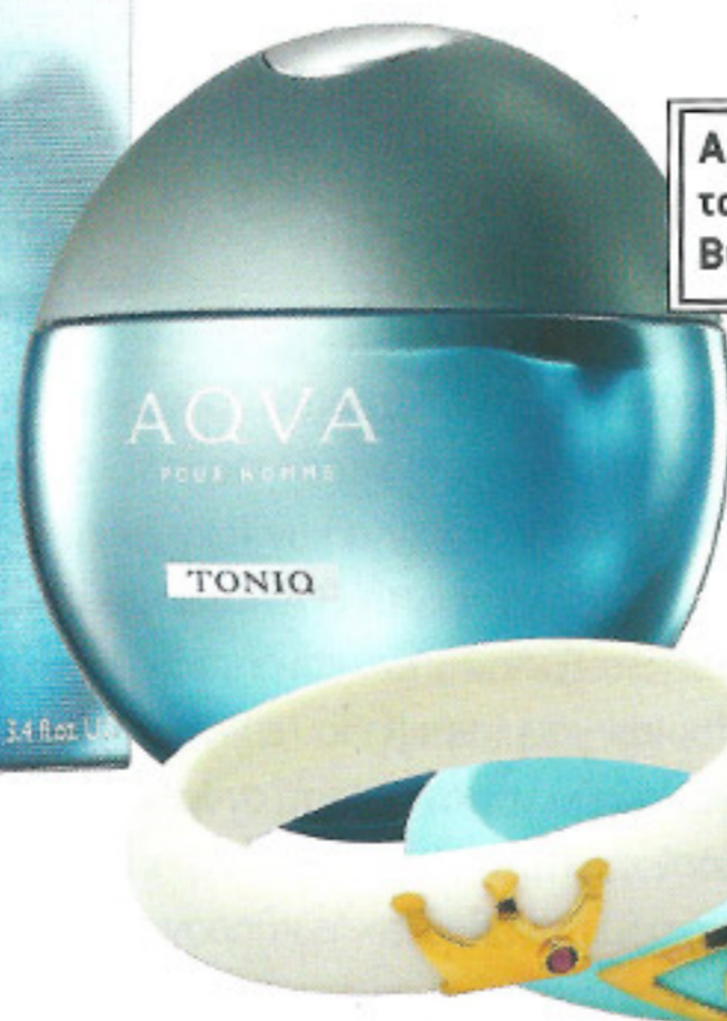
Βραχιόλια σε διάφορες αποχρώσεις, Gregio, www.gregio.gr